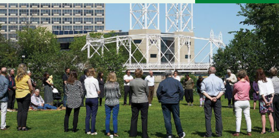
La cérémonie du calumet de juin 2017 a marqué l'engagement des membres de l'initiative En route envers une approche d'espace éthique dans le cadre de cette initiative (p. 14-15, rapport Unis avec la nature ).

"« ...conformément à l'approche pancanadienne élaborée conjointement par les gouvernements fédéral, provinciaux et territoriaux pour appuyer les progrès vers l'atteinte de l'Objectif 1, il est recommandé que la collaboration avec les Autochtones tienne compte des principes de l'espace éthique en tant que dialogue ouvert dans le cadre duquel les divers secteurs de compétence peuvent mener des discussions utiles, respectueuses et interculturelles, dans le contexte desquelles les systèmes de connaissances autochtones sont pris en considération en même temps que la science occidentale ». (Tiré du rapport Unis avec la nature , p. 5)